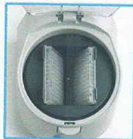
Before & after centrifugation