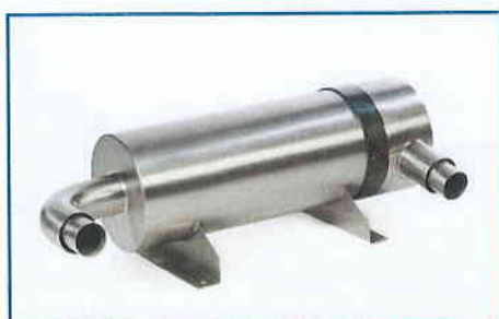
Filter units are available in standard, HEPA and toxic versions.

Labplant offer a number of different options to compliment and enhance the usage of our units. These range from custom size nozzles to a dual cyclone system for the collection of fine particles.