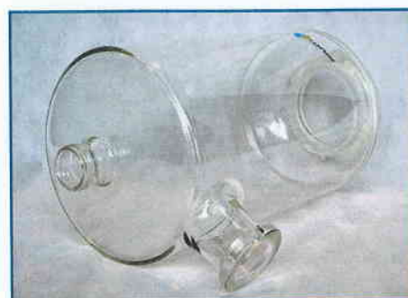
Replacement glassware and spares kits.