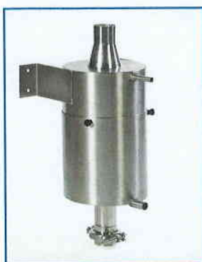
Wet scrubber unit is integrated in to the spray dryer during manufacture.