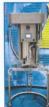
SD-06 fitted with dual cyclone system.

For further information, quotations or advice please contact us at: