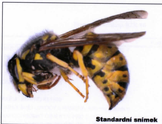
Standardní snímek s ostrou pouze spodní částí vzorku

Deep Focus je přídavný softwarový modul k programům QuickPHOTO CAMERA, MICRO a INDUSTRIAL. Modul je určen pro vytváření digitálních snímků s hloubkou ostrosti mnohem větší, než jaké je možné dosáhnout běžným použitím optických mikroskopů. Využívá se při práci se stereomikroskopy i ostatními typy mikroskopů při pozorování v procházejícím i odraženém světle a také pro makrofotografii. Modul Deep Focus umožňuje proces vytváření snímků, při použití volitelného přídavného modulu pro motorizované ostření, automatizovat.